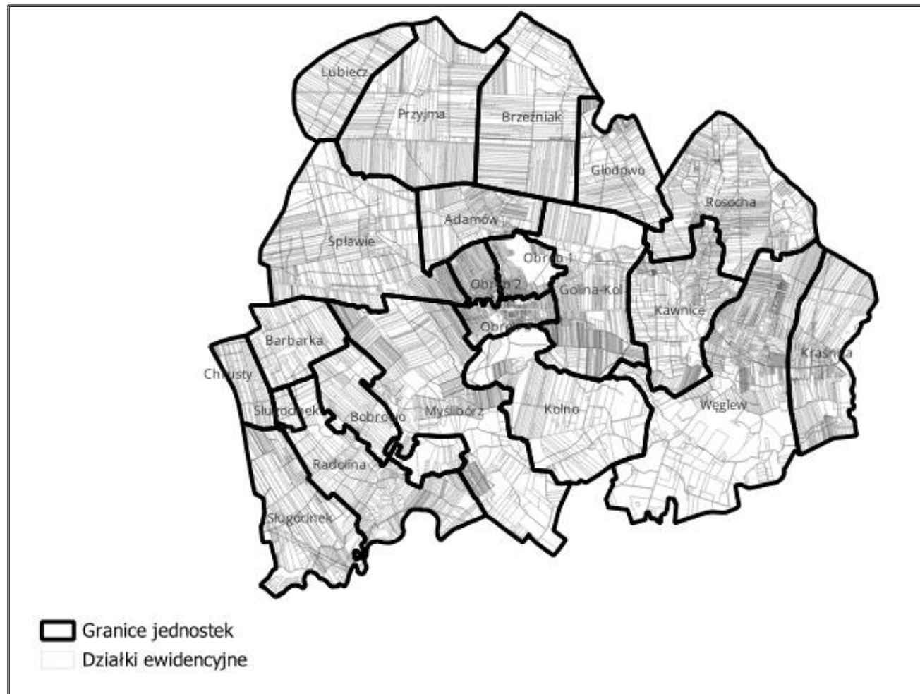
Rysunek 1. Podział gminy Golina na jednostki osadnicze